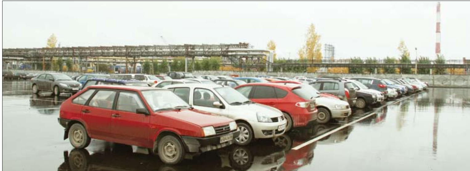
Стоянка у КПП-5: совсем недавно здесь было болото, а сегодня безупречный объект дорожного строительства.