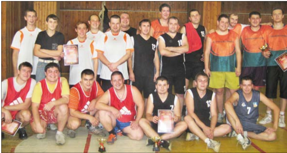
Участники спортивного мероприятия.