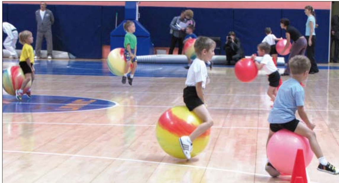
Бежать умеют все, а попробуй победить верхом на шаре!