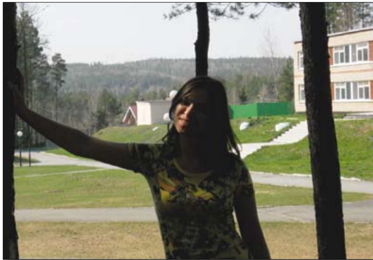
В «Селене» можно и погулять...

Осень – любимейшее время для того, чтобы выбраться на природу дружеской компанией. Во-первых, закрыт садово-огородный сезон,