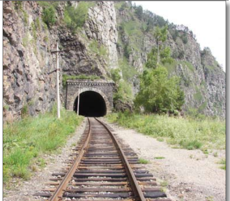
Байкальская железная дорога.

А у нас сегодня утро, хмарь и водопады реки Подкомарной. Распадок, по которому бежит эта река, местами напоминает ущелье. Перепады высот изрядные, и река стекает вниз каскадами водопадов. Очень не хватает солнца, чтобы в полной мере оценить красоту.