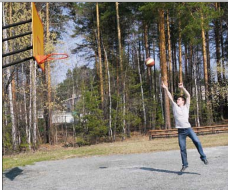
... и в баскетбол поиграть.

А какой же аппетит на природе! Да, в стоимость путевки входит полноценное трехразовое питание, которого хватит, чтобы подкрепить силы после любой нагрузки. Но большинство все-таки уважает на свежем воздухе хорошо приготовленное мясо.