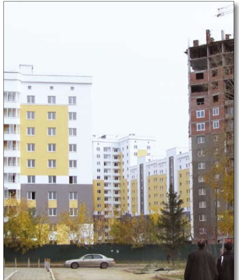
Садовый — первый в Верхней Пышме пример комплексного освоения территории.