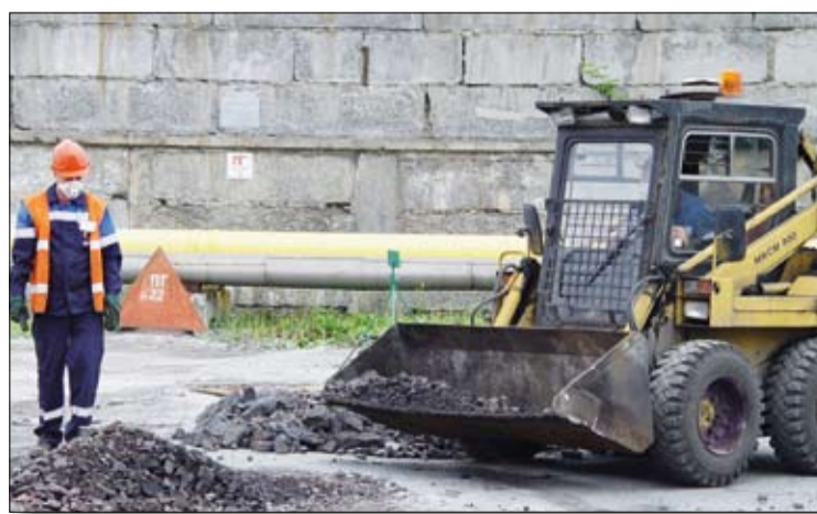
С помощью автопогрузчика шихтовщики находят и удаляют из шлаков (сырья для шахтных печей) тугоплавкие, огнеупорные предметы.