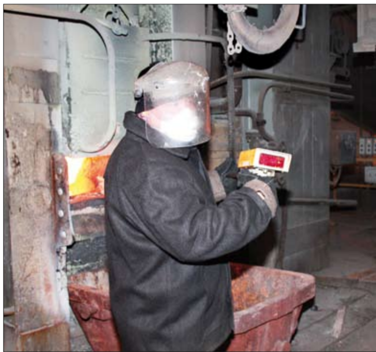
Термопара ошибается редко, но плавильщики привыкли доверять личному опыту и интуиции.

бой все тонкости подхода к практическому заданию. Плавильщик, глядя на степень нагрева поверхности металла, должен принимать решение мгновенно, оперативно — либо начинать розлив металла, либо подождать немного (довести до нужной температуры).