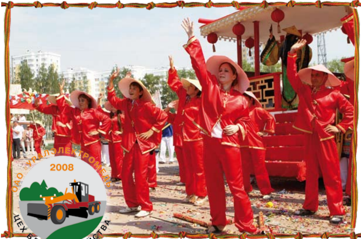
«Китайцы» из цеха благоустройства умеют отлично танцевать.