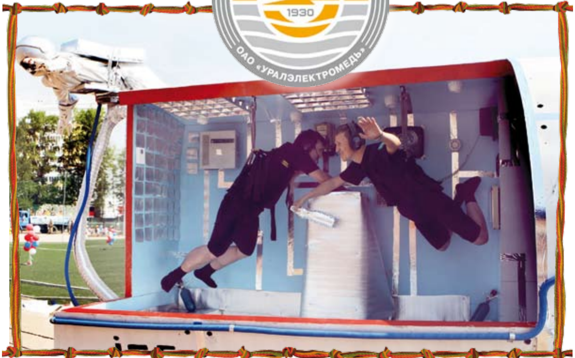
Вот она, наша космонавтика от Гагарина до МКС в представлении коллектива энергоцеха.