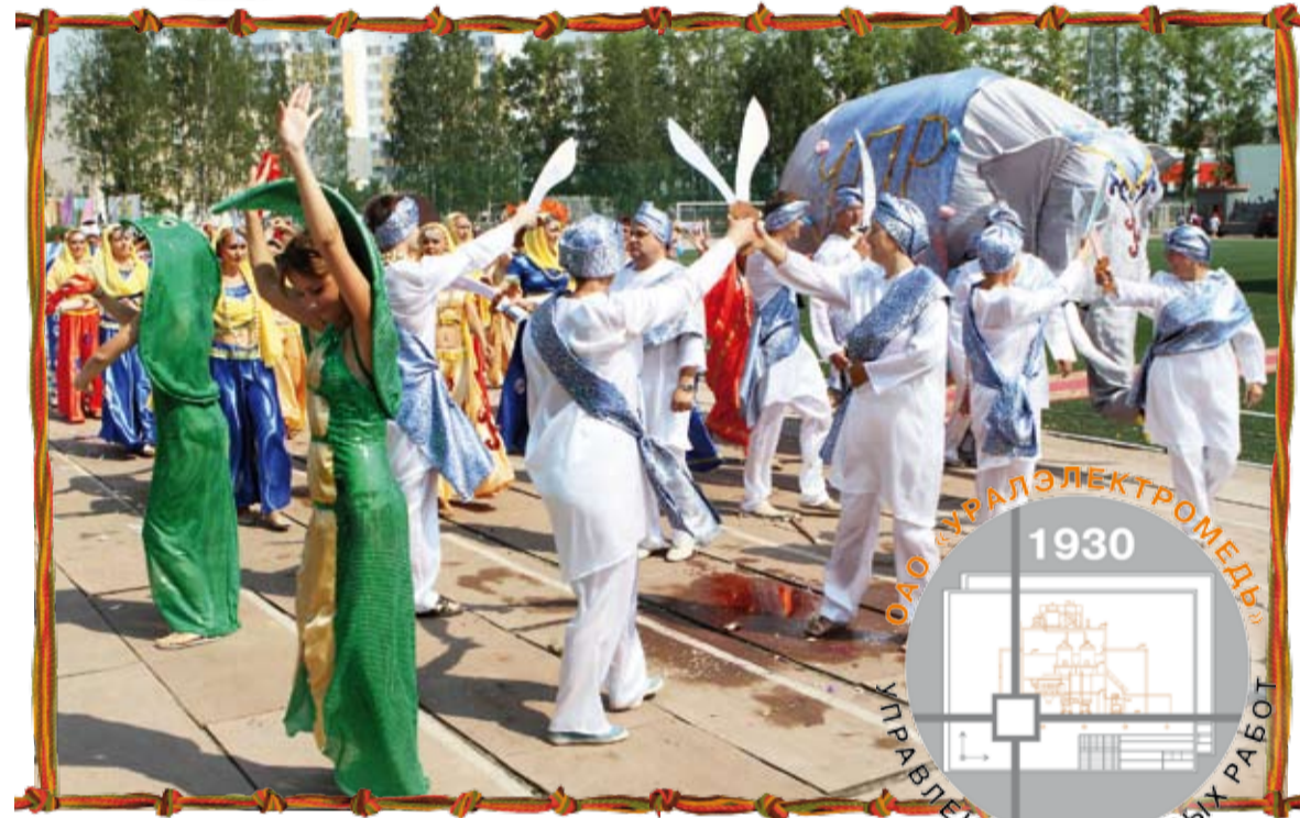
Индусы из УПР и их очаровательный слон празднуют победу.

В ЭТОМ мнении сошлись все члены жюри карнавала. И победителя в этом году выбрали тоже единогласно.