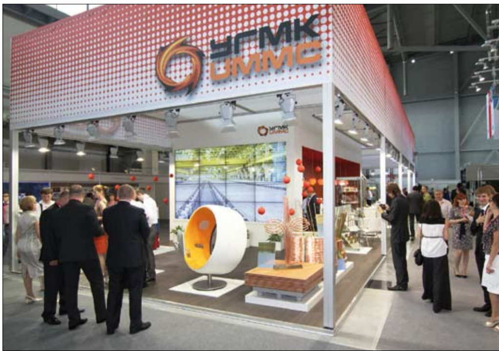
Виртуальная прогулка по новому цеху электролиза меди начинается.