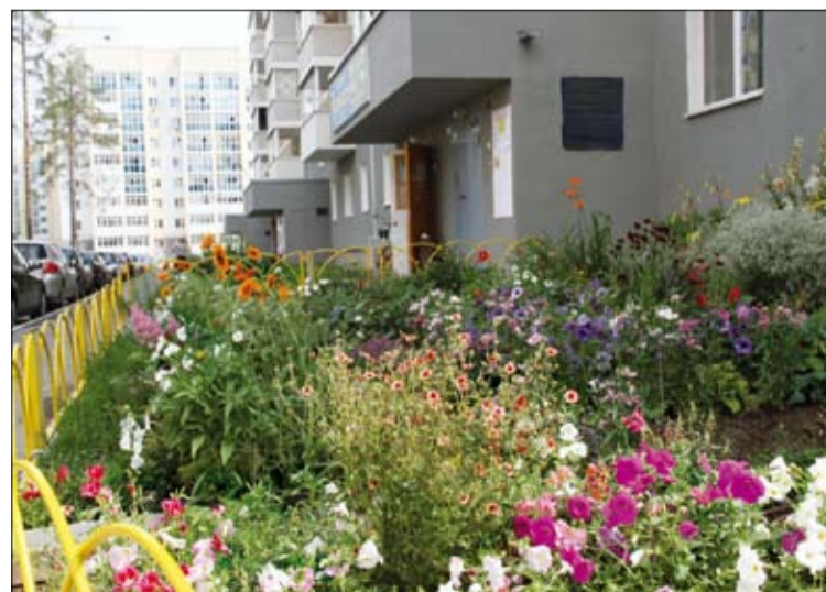
Один из цветущих дворов-победителей.