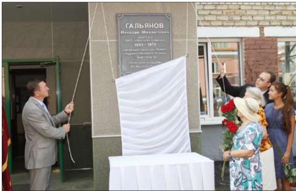
Торжественный момент. Мемориальная доска открыта.