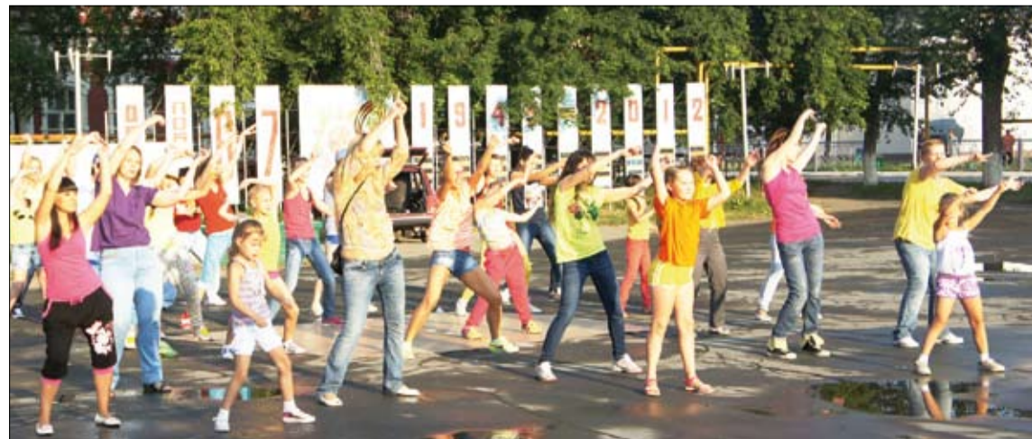
Таким весёлым и ярким получился флешмоб.