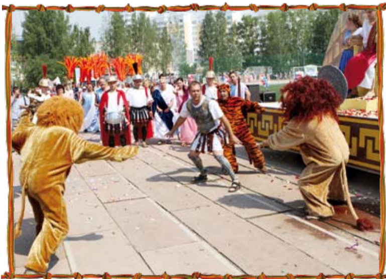
Спартак из Катур-Инвеста победит в неравной схватке с дикими зверями!