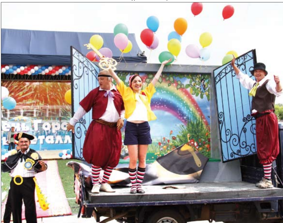
«Золотой ключик» открыл волшебную дверь!