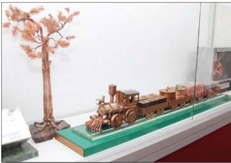
«Изюминка» экспозиции ОАО «Уралэлектромедь».