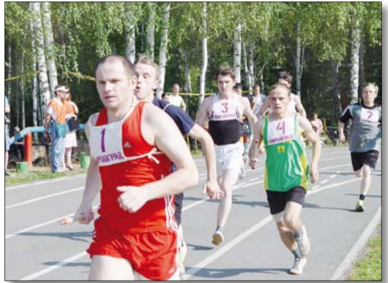
На беговой дорожке разгорелись нешуточные страсти.

Не менее зрелищными были и состязания по перетягиванию каната. Тактика ведения боя, поддержка болельщиков, личная силушка — все шло в ход. И вновь метцех впереди. Плечистые парни из энергоцеха на втором месте. На третьем — силачи ЦПШ.