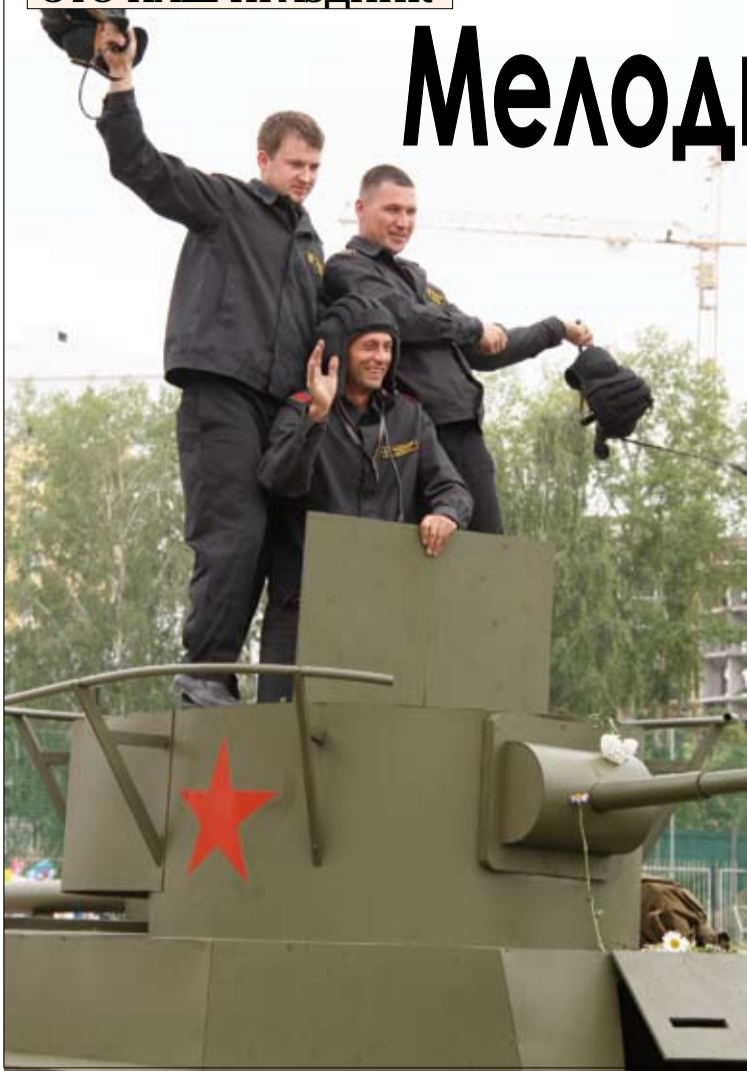
Карнавал открыли «Три танкиста».

КАРНАВАЛ – апофеоз праздника: его ждут, к нему готовятся едва ли не целый год, от даты до даты, репетируют, шьют костюмы, строят декорации. И день массовых гуляний в честь Дня металлурга и Дня города – суббота, 16 июля – с утра был наполнен ожиданием костюмированного шествия: хотелось себя показать, на других посмотреть, посостязаться в артистизме, изобретательности, коллективной сплоченности.