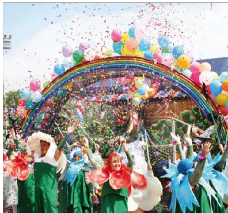
«Звездное лето, будь со мной!»

Попова «Цирк», завоевав в итоге третье место Карнавала-2011. Это было чрезвычайно зрелищно: на арене тягались силачи, дурачились клоуны, изумляли ловкостью жонглеры. Заставил вздрогнуть знаменитый трюк факира с перепиливанием девушки, а в конце выступления в небо из пушки вылетела легендарная Мэри. С этой же тематикой и песней «Куда уехал цирк?» удачно дебютировала колонна склада сырья.