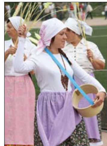
А ну-ка, девушки!