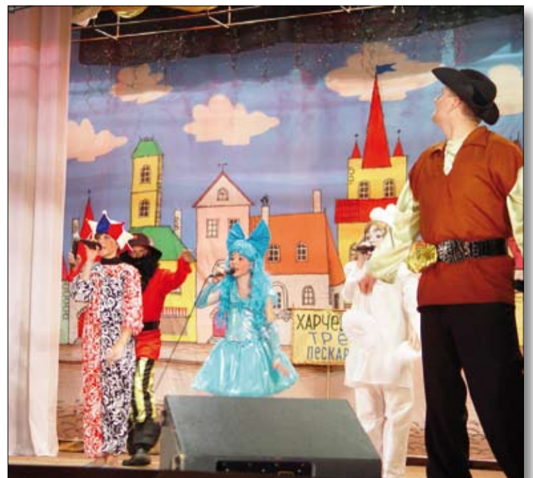
Дуэт Мальвины и Пьеро.