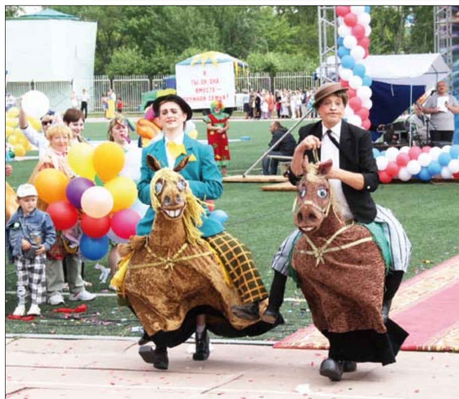
В гостях — никулинские лошади.