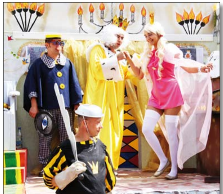
«Ах ты бедная моя трубадурочка».