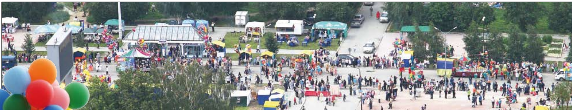
Праздник с высоты птичьего полета.