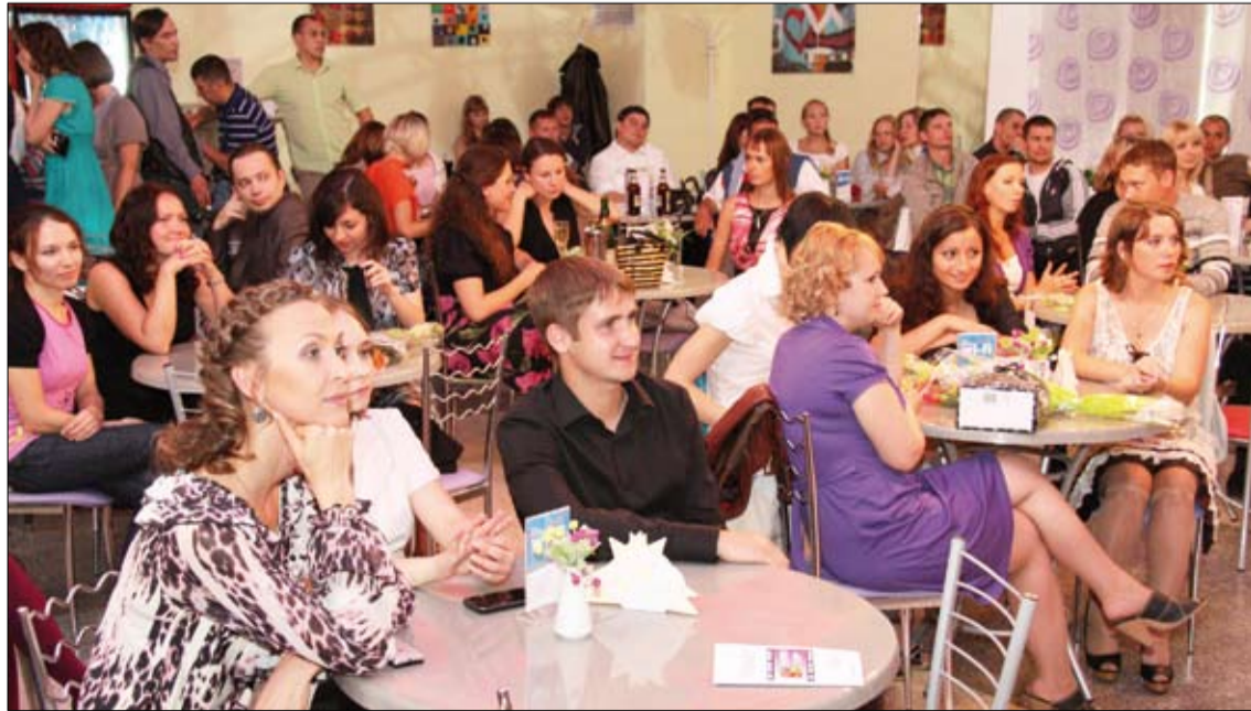
Развлекательная часть вечера в кинобаре.