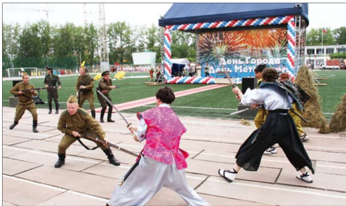
«И летели наземь самураи под напором стали и огня».

Тему цирка раскрыл теплотехнический цех под песню Олега