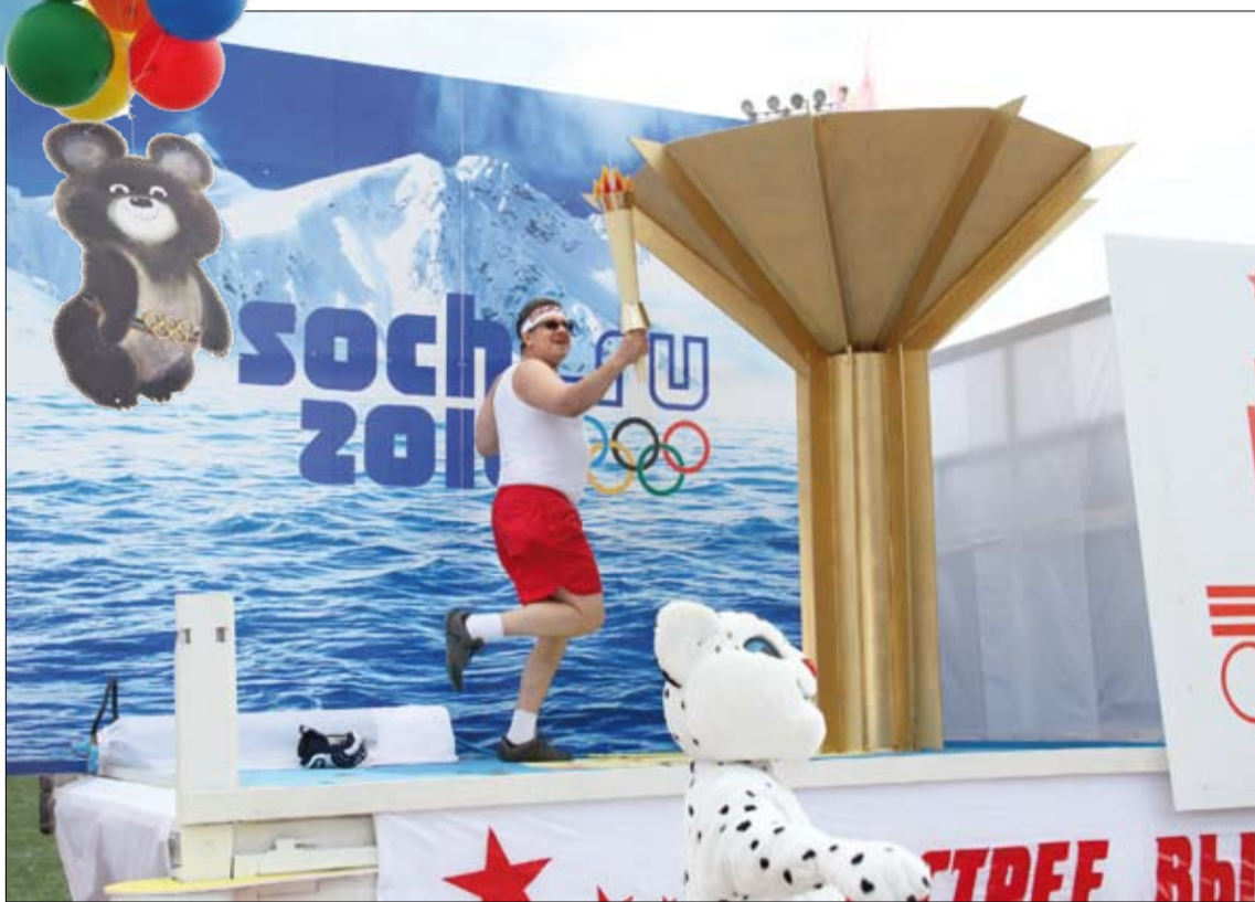
Олимпийские символы встретились в Верхней Пышме.

небе появилось солнышко. Это выступление покорило не только зрителей, но и жюри, и заслужило специальный приз Карнавала-2011.