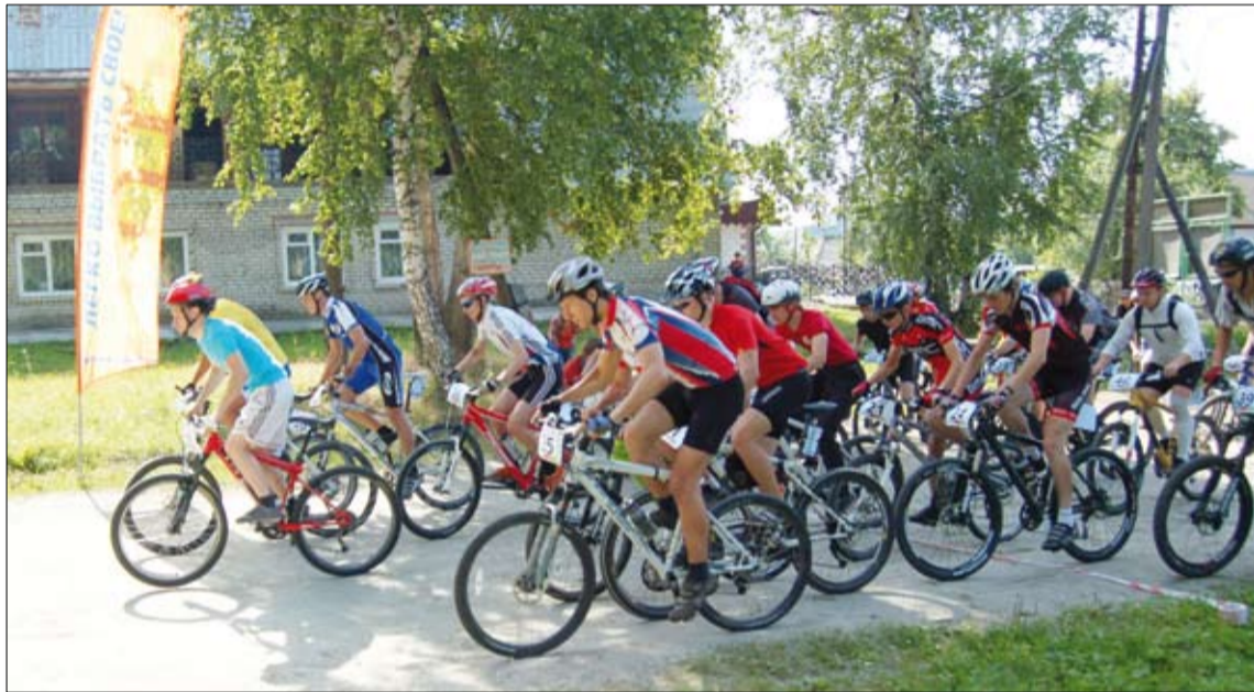
Массовый старт в категории «Мужчины-любители».