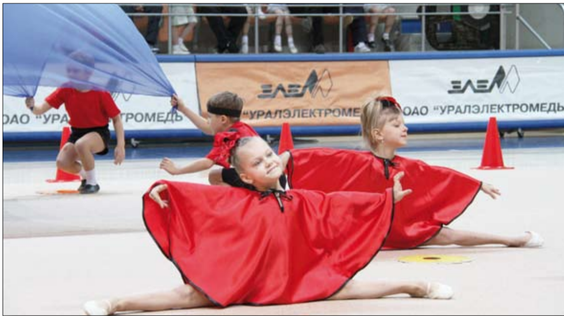
Композиция «Божьи коровки» покорила сердца зрителей.