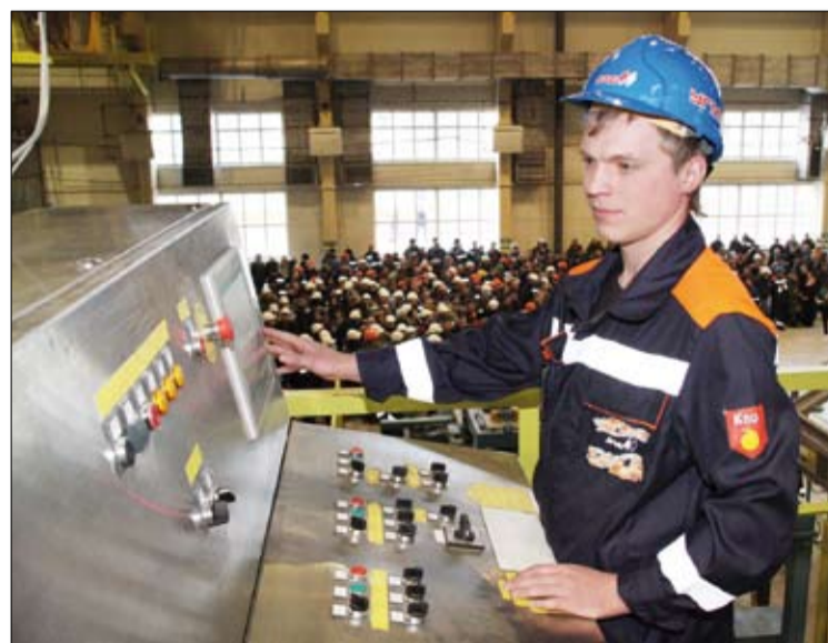
К пуску всё готово.

– Сегодняшнего события мы ждали несколько лет. Даже не ждали, мы интенсивно работали. Трудились все, кто имеет отношение к реализации проекта: проектировщики, строители, металлурги, все структурные подразделения нашего предприятия. И сегодня мы с гордостью сдаём в эксплуатацию новое, самое современное произ-