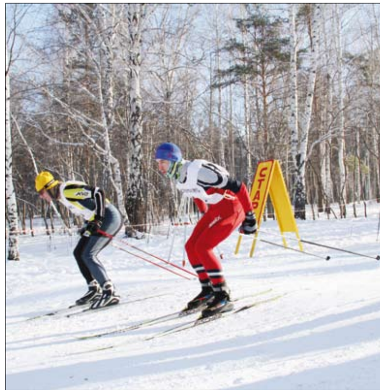
«На старт. Внимание. Марш!»