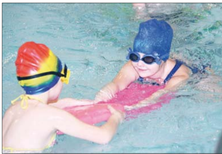
Бассейн во Дворце спорта УГМК, где все от мала до велика могут заниматься плаванием – тоже один из социальных проектов компании.

– То, что мы делали, делаем, и собираемся делать, ни в коем случае не противоречит социальной концепции Владимира Путина. Я думаю, что если все планы воплотятся в жизнь, мы по-прежнему будем участвовать в социальных программах: дополнять в сфере об-