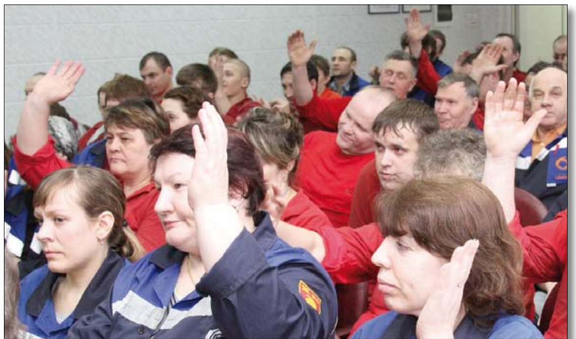
«Голосуем за будущее».