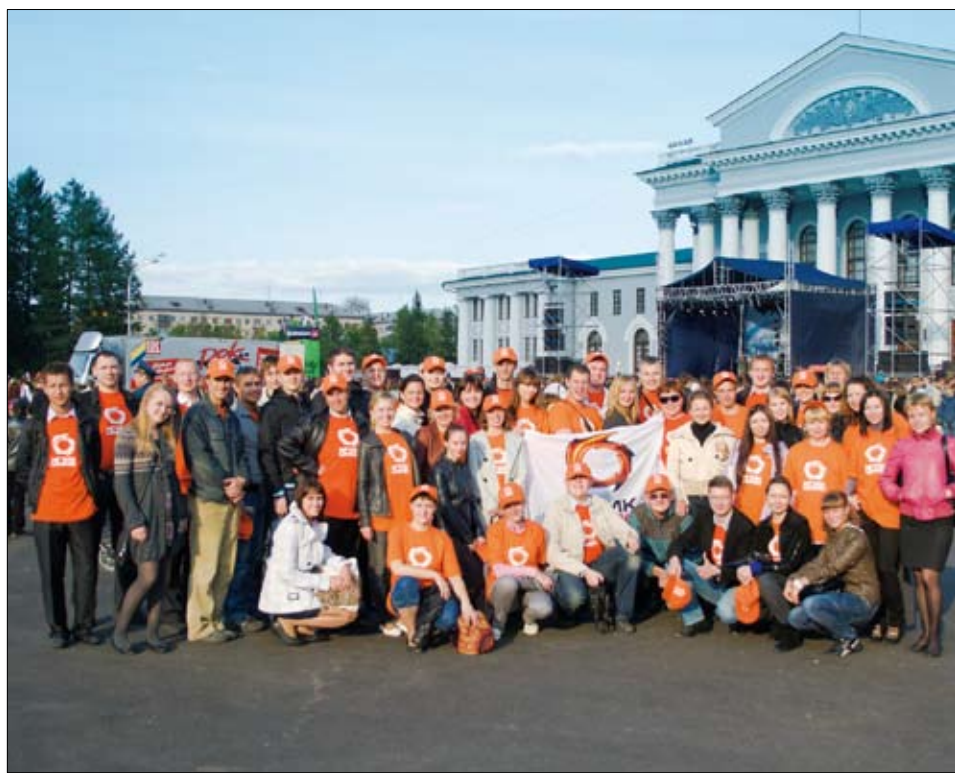
Делегация УГМК на торжествах, посвященных юбилею Уралвагонзавода.