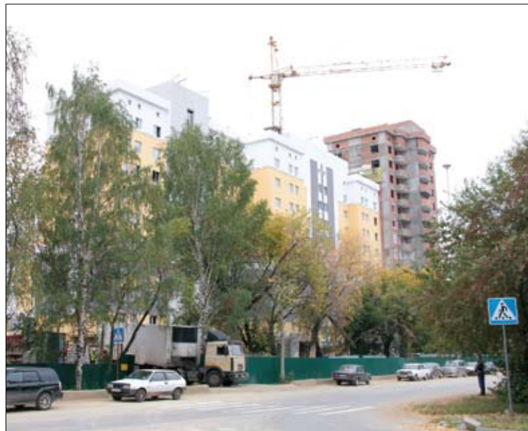
Скоро тепло придет и в Садовый.

С ТОЧКИ ЗРЕНИЯ теплоснабжения, Кировград — один из самых проблемных городов в зоне ответственности ОАО «Уралэлектромедь». Несколько лет назад стало ясно, что без помощи градообразующего предприятия горожанам не обойтись. И тогда кировградский участок ООО «УЭМ-Теплосети» взял ответственную работу — отопление нескольких районов — на себя.