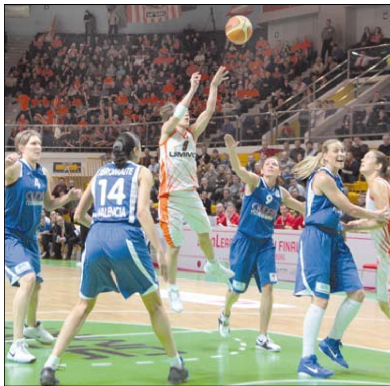
Фанаты не пропускают ни одной игры любимой команды.

Что заставляет этих ребят покидать дом, откладывая в сторону уроки и экзамены и следовать за любимой командой по всей России? Почему они готовы жертвовать прогулками с друзьями, просмотром телевизора ради пары часов на трибуне во время матча во Дворце спорта?