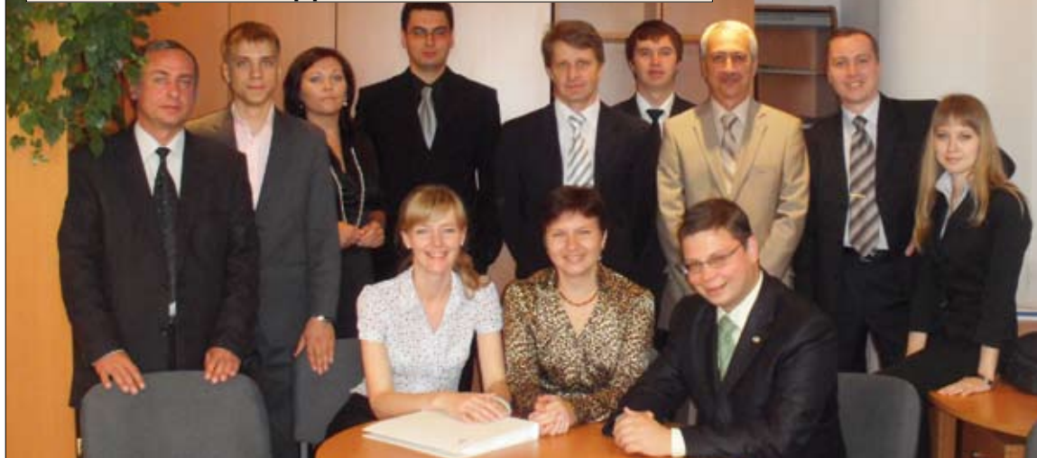
Дружный коллектив отдела разработки и внедрения информационных систем.

ЗВУЧИТ очень сложно, выглядит еще сложнее: «информационные системы (ИС) — совокупность аппаратных и программных средств, которые обеспечивают взаимодействие и выполнение определенных функций, необходимых специалистам (пользователям этих систем) в своей профессиональной деятельности». По сути, программирование — это создание того, чем информационная система (думает). Этой сложной и ответственной работой занимаются программисты. И именно эти программы и облегчают сегодня работу во всех абсолютно отраслях и сферах человеческой деятельности.