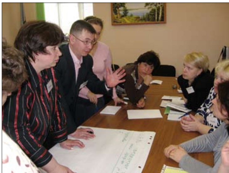
Заседания профкома всегда проходят оживленно.