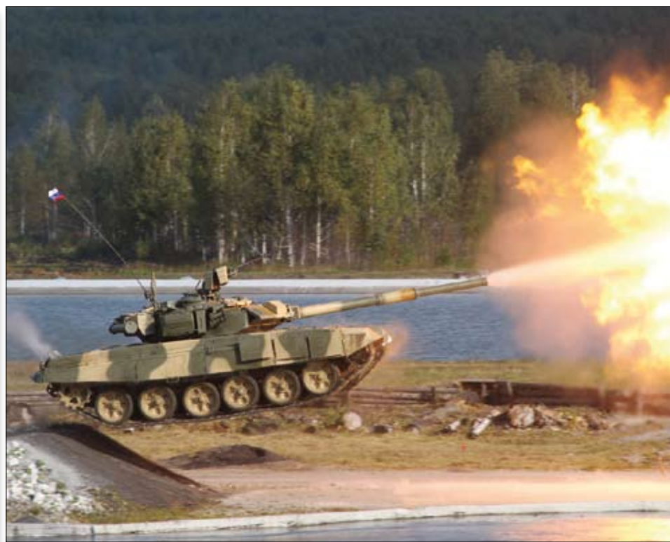
Танк Т-90С в боевом полете.