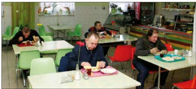
В рабочей столовой чисто, уютно и кормят вкусно!

Профкомом ежемесячно выделяются средства на поздравление юбиляров за стаж работы (370 человек). С 2011 года сумма единовременной выплаты увеличена в два раза. Ветеранам к Дню пожилого человека выплачено 100 тысяч рублей. Материальная помощь многодетным семьям, опекунам, детям-инвалидам составила 100 тысяч рублей.