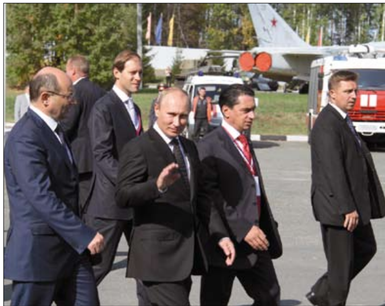
Председатель Правительства РФ Владимир Путин на полигоне Старатель.

По словам российского премьера, на выставке представлены серийные и перспективные отечественные образцы техники, созданные российскими оружейниками, и здесь «действительно есть что посмотреть». Владимир Путин, в частности, отметил разведмашину «Рысь», модернизи-