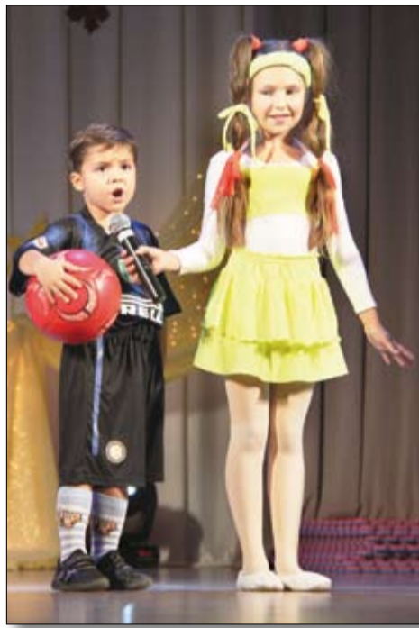
Самые трогательные выступления — от малышей-спортсменов.

ГОВОРЯТ, у любого концерта и вечера есть своя энергетика. И зависит она не только от того, кто выходит на сцену. Не менее важно и то, кто собрался в зале. Утверждение это как нельзя лучше подтвердили представители ветеранской организации ОАО «Уралэлектромедь», которые собрались 29 сентября в ДК «Металлург», чтобы отпраздновать День пожилых людей.