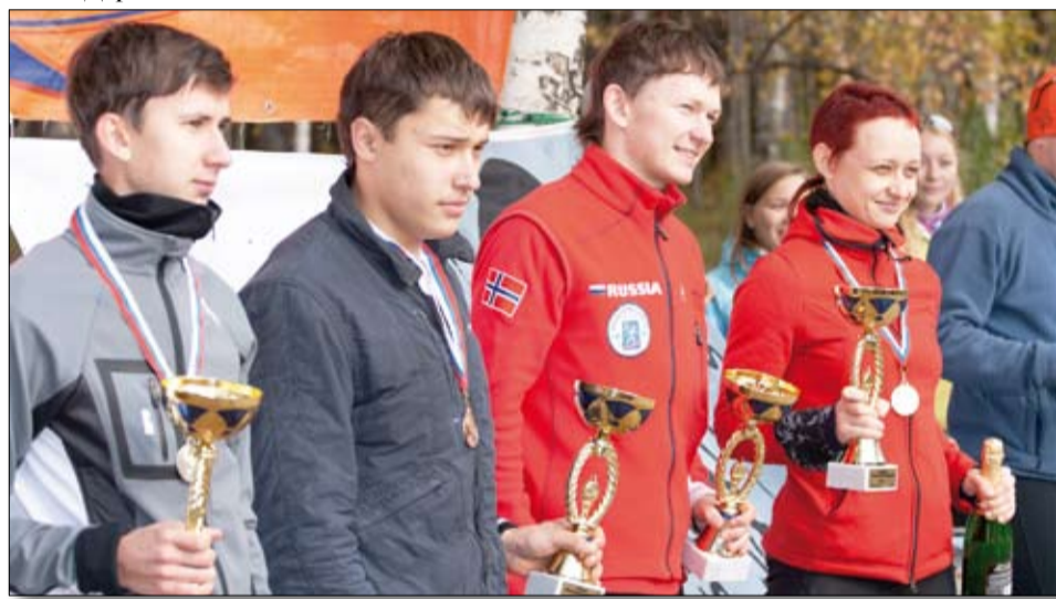
Абсолютные победители Кубка «Четырехлистник».