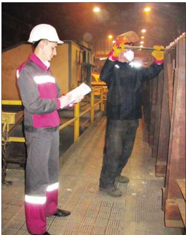
Обнаружить дефект — дело нелегкое.