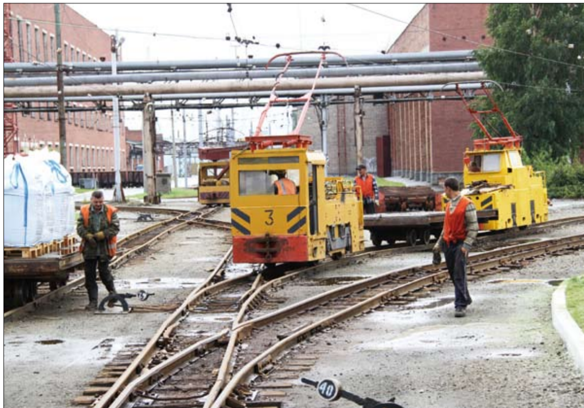
Железнодорожные пути – главные артерии на промышленном предприятии.