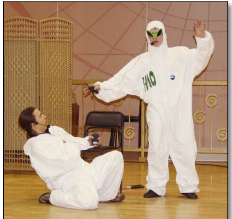
Космическая вариация от управления проектных работ.