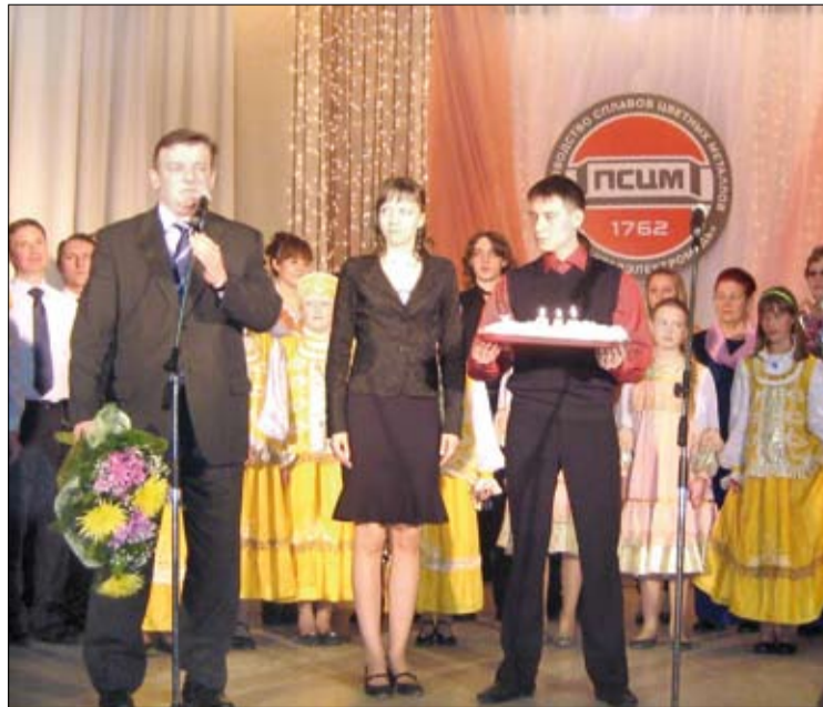
Вот он — настоящий день рождения!