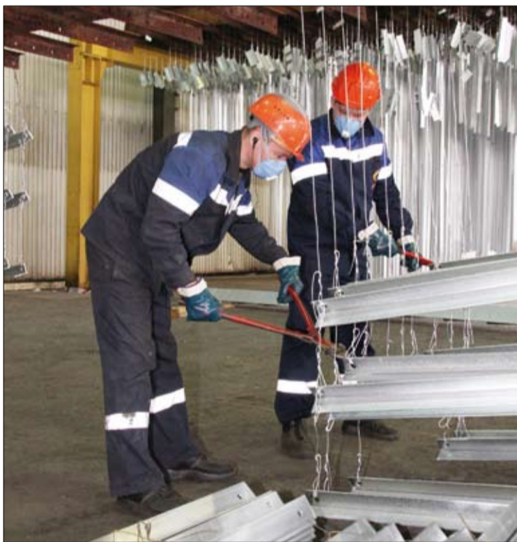
Навеска металлоконструкций — дело ответственное.

Как известно, даже самое новое и качественное оборудование нуждается в усовершенствовании. И с начала 2010 года в ЦГЦ ведется инновационная работа. Интересные идеи на бумаге здесь не остаются.