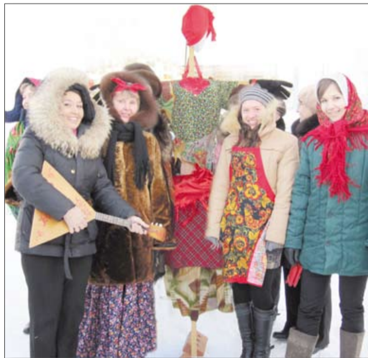
Один из любимых праздников в Верхней Пышме – Масленица.

Свердловской области за работу по сохранению национальных культур.