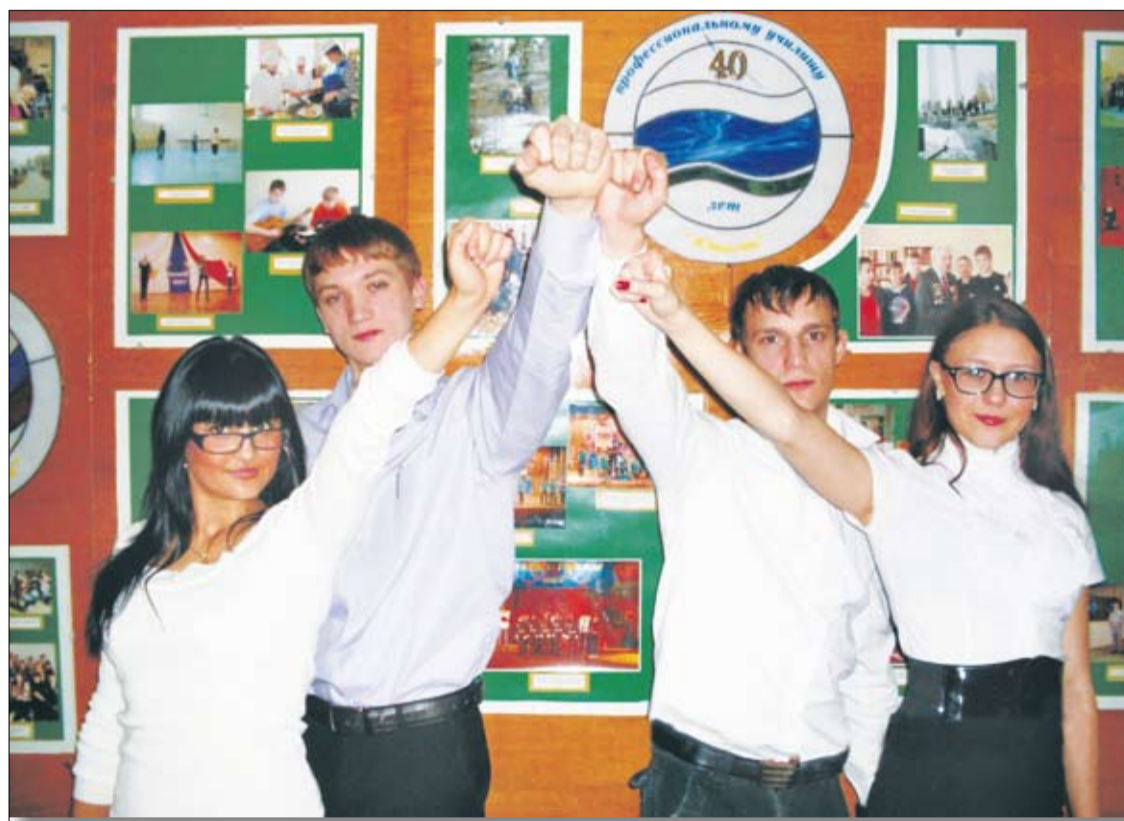
Студенты «Юности» готовы стать рабочими.

Новизна этого соглашения в том, что подготовка кадров для предприятия распространяется и на учащихся кадетской школы-интерната: напомним, эта школа действует уже шестой год, и в этом году очередной выпуск (девятнадцатиклассники) охвачен целевыми программами Уралэлектромеди как базового для нас предприятия.