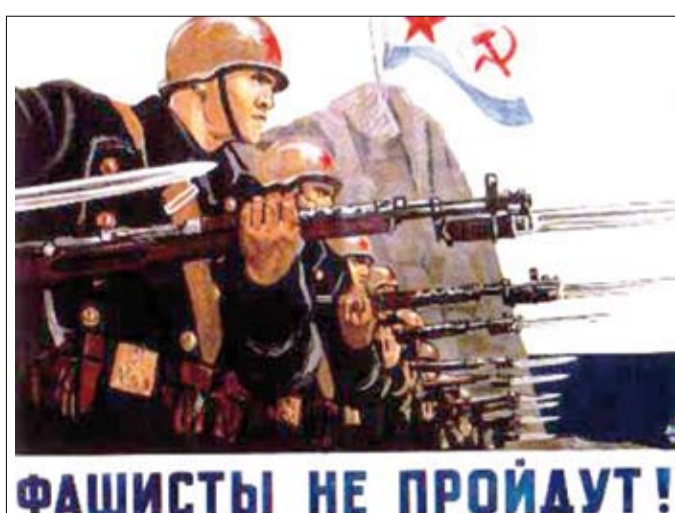
Это наши братья противостоят фашистам, это наши стальные штывки направлены на врага