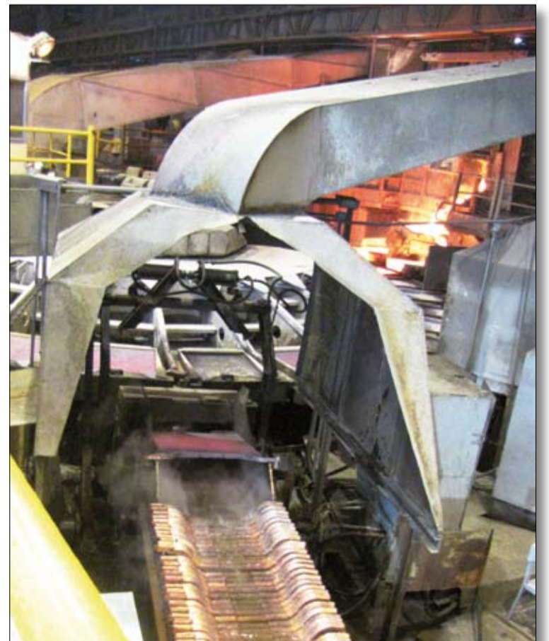
Каким бы совершенным ни было оборудование, изобретателям всегда есть простор для творчества.