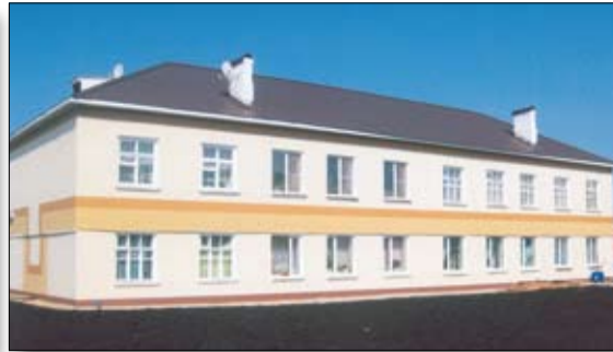
Почти волшебное преображение дома номер девять по улице Козицына: съемки зимой и весной этого года.

— от перекрестков с улицами Козицына и Спицына.