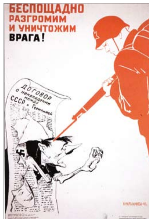
Вера в победу и в этом плакате работы Кукрыниксов