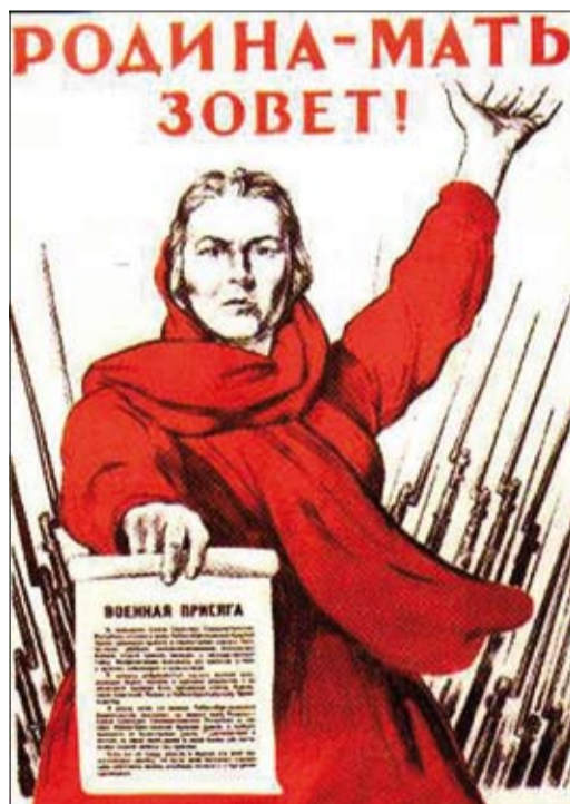
Конечно, самым памятным из них стал этот.

Бойцами стали вчерашние рабочие и крестьяне, а на полях, у станков в заводских цехах их заменили женщины – жены и матери. И настроение тех дней, решимость, твердость, веру в будущее лучше всего сохранила, пожалуй, наглядная агитация тех времен, советские плакаты.