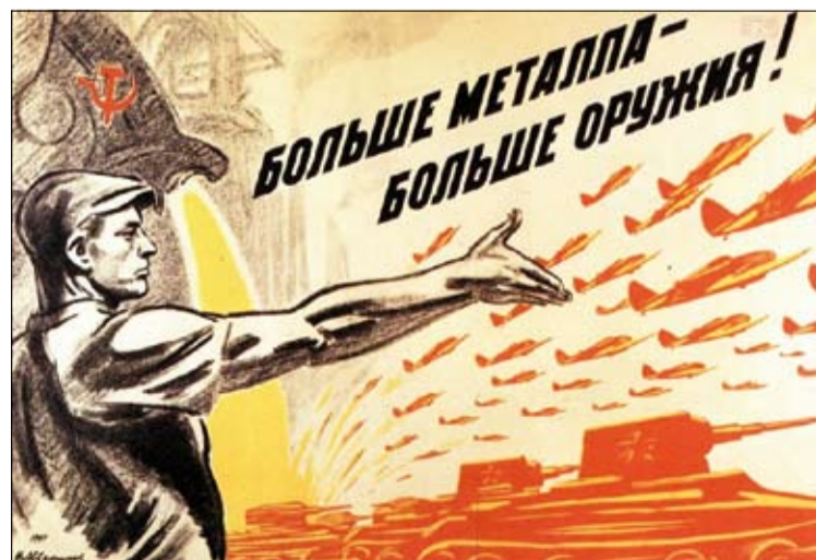
А этот яркий и образный призыв к тем, кто остался на заводах, и сегодня кажется обращенным к каждому из нас