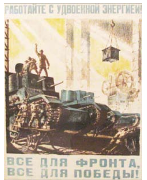
Лозунг «Все для фронта, все для победы!», тоже пришел к нам с плаката.