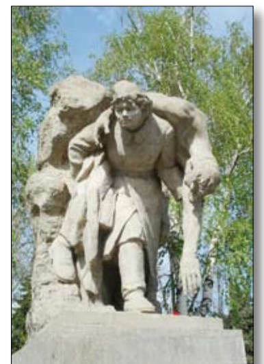
Этот монумент посвящен подвигам женщин на войне.