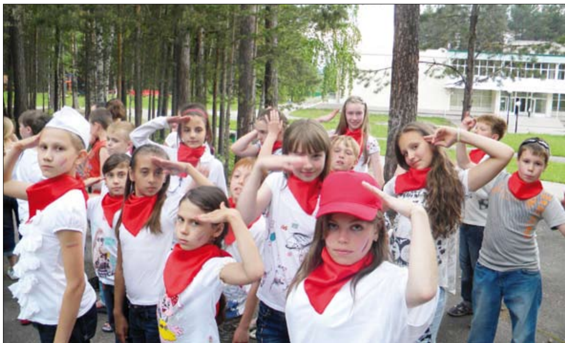
«Город Медведевых» участвует в смотре строя и песни.