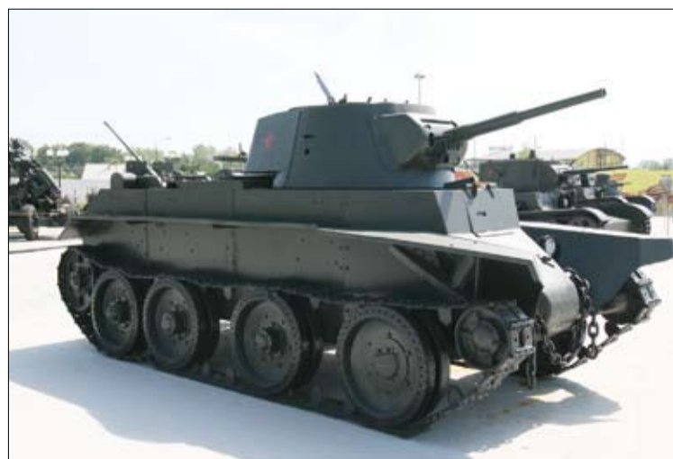
Наш БТ-7 принимал участие в боях на Волховском фронте в 1942 году.