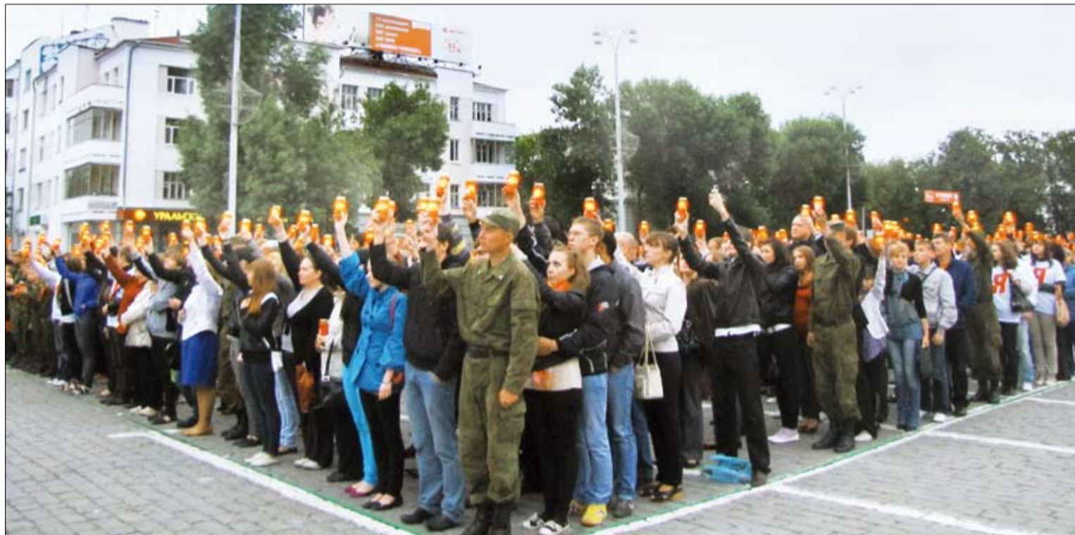
Молодое поколение — В живом слове «Помним».

ТАНК БТ — своеобразный символ одного из самых неоднозначных периодов советской истории — предвоенного десятилетия. Чтобы удостовериться в этом, достаточно пересмотреть документальные съемки ноябрьских парадов 1930-х годов. Не зря эти боевые машины называли «летающими танками» — «бэтешки», мчавшиеся на огромной скорости по брусчатке Красной площади, и сегодня вызывают восхищение.