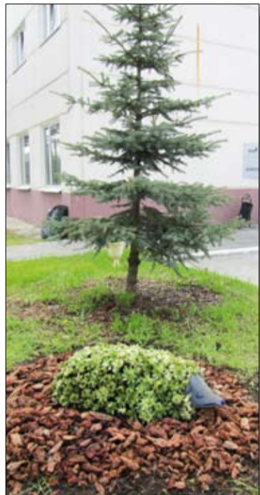
Диковинка – цветочный «кежик».