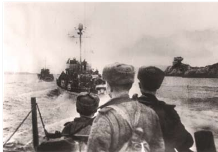
Петсамо-Киркенесская операция. Операция по высадке советских войск на Киркенес, Норвегия.

Я прочла главы из книги Григория Свирского «Штрафники», которые посвящены Вам. И я восхищаюсь Вашей отвагой. Когда Вас осудили за то, что Вы не совершили, и приговорили к расстрелу, а потом отправили на фронт, вы не ожесточились, не сдались в плен на милость победителя, а продолжили воевать и бить врага. Это ли