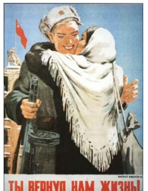
И вот он, долгожданный день!