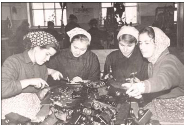
А так здесь было лет 30 назад.

А начиналось все в июле 1946 года, когда решением исполкома Свердловского областного Совета депутатов трудящихся был создан Верхнепышминский инструментальный завод № 10 Облметаллотреста на базе производственных площадей и промфонда ликвидированного горпромкомбината. В 1948 году предприятие, которое производило тогда серпы, лопаты, ложки, банки, было переименовано в металлзавод № 10. В декабре 1952 года, в соответствии с постановлением Совета Министров РСФСР, на предприятии начали осваивать производство металлических заводных игрушек. И в марте 1954 года с конвейера сошла первая партия, а уже в 1960 году на ВДНХ СССР экспонировалось 15 видов игрушек, собранных в Верхней Пышме. В 1965 году завод переименован в фирму «Радуга», а позднее — в одноименное производственное объединение.