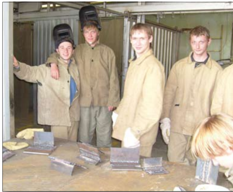
Я не рабочий, я только учусь...

— Сегодня ОАО «Уралэлектромедь» — это единственное предприятие на территории нашего городского округа, которое ведет работу по профориентации молодежи, начиная со школьной скамьи, пропагандируя именно рабочие специальности, повышая имидж и престиж рабочих профессий.