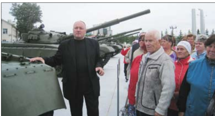
Гости из Верх-Нейвинского на экскурсии.

Дата была выбрана не случайно, 66 лет назад, 24 июня 1945 года, в честь Великой Победы русского народа над фашистскими захватчиками по Красной площади Москвы прошел грандиозный парад.