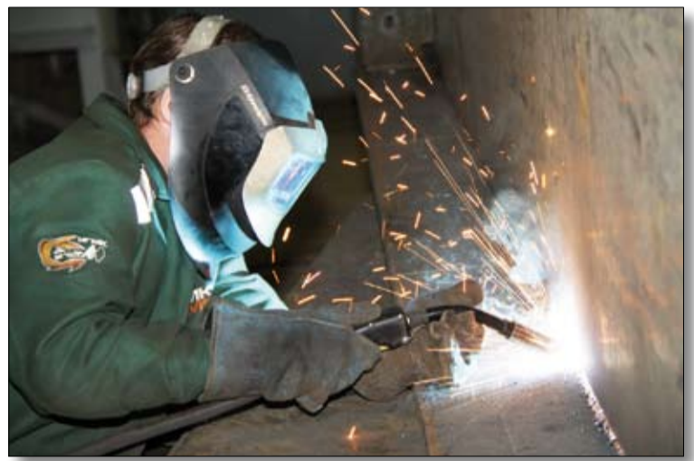
Зона особой ответственности — каждый миллиметр.

общем подсчете это может сыграть решающую роль. Но сказывается волнение участников — торопятся, и в результате получаются некачественные образцы сварки. Ладно, здесь, на конкурсе — куски металла, а если при сварке на оборудовании допустишь ошибку?! Пиши пропало. И все участники прекрасно понимают свою ответственность, на производстве брака не допускают. Потому и участвуют в конкурсе.