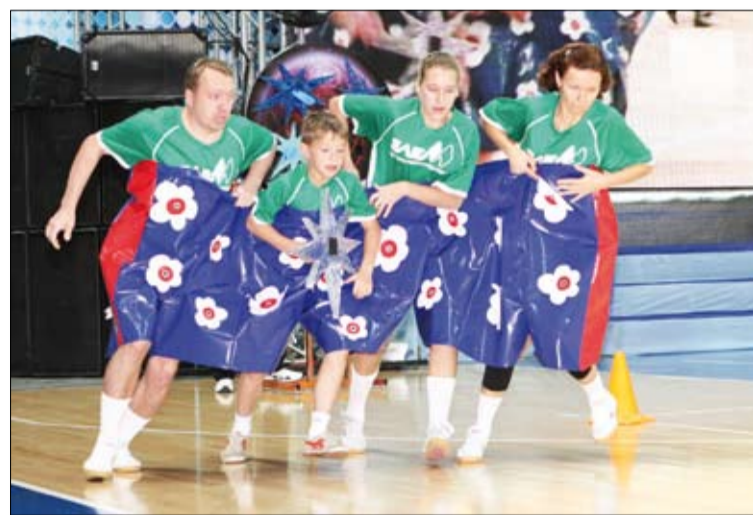
В спорте, как и в жизни, главное – сплоченность и воля к победе.