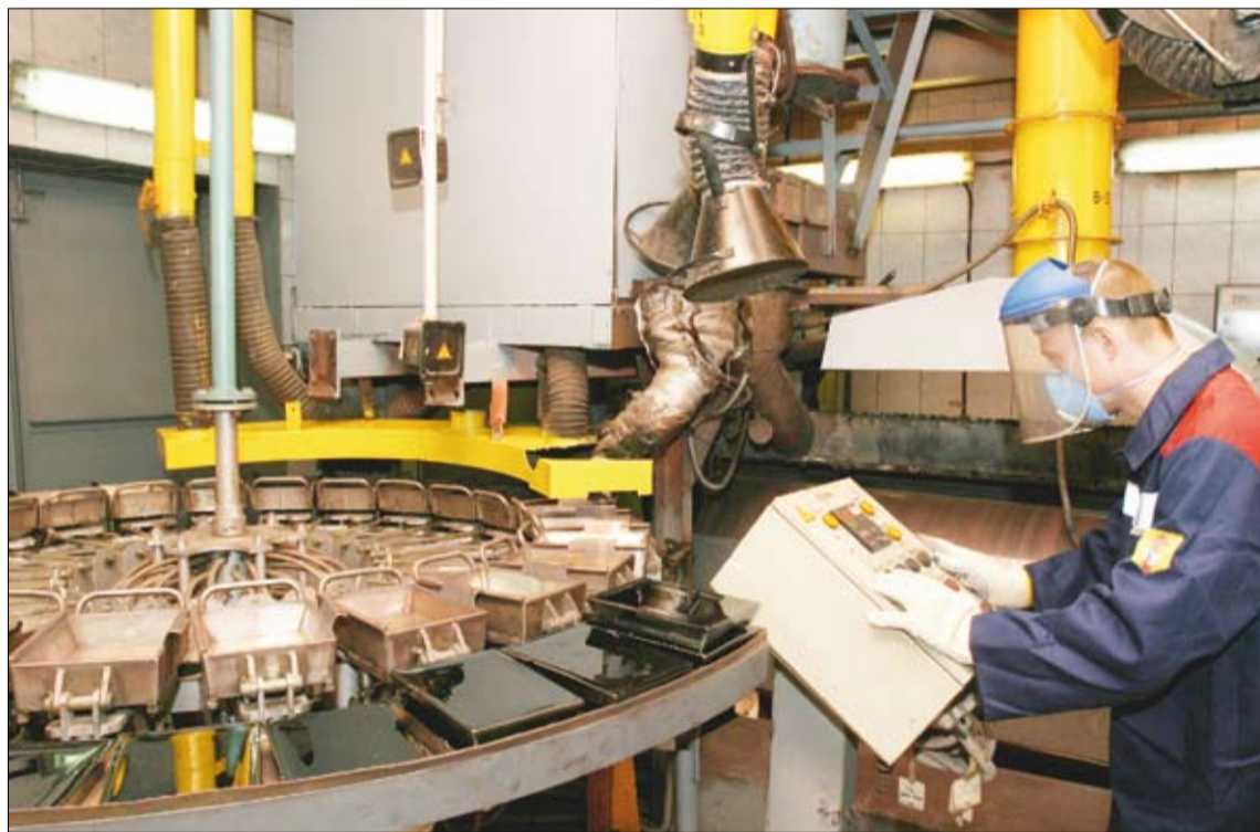
Идет розлив селена.

изводства меди, по сути, производственные отходы). А параллельно в химико-металлургическом цехе планируется модернизация линий по производству селена и теллура. Главная задача этой работы — увеличение объемов производства.