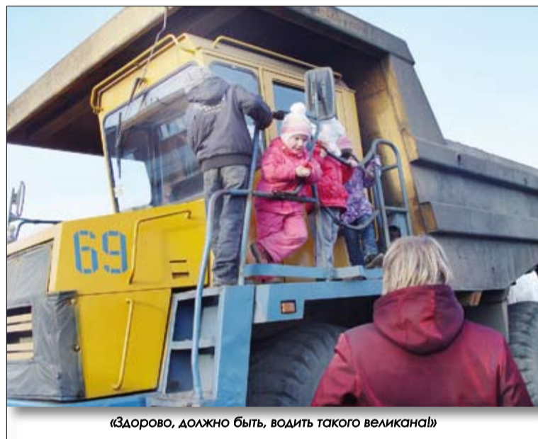
«Здорово, должно быть, водить такого великана!»