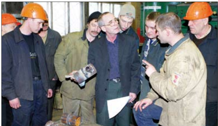
Снимок Андрея Петухова, сделанный на конкурсе профмастерства в ЦПРО, оказался среди победителей в проекте «Славим человека труда!»