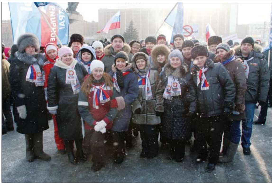
На митинг – как на праздник.

ромедь» и других предприятий УГМК, работающих на территории Свердловской области, не заметить было трудно. Яркие бело-голубые знамёна с логотипом компании и слоганом «Мы за стабильность» и издали заметные шарфики, оформленные в цвета российского триколора, выгодно отличали «наших». Хотя чужих «под варежкой» (а именно так называют привокзальную площадь жители Екатеринбурга) и не было.