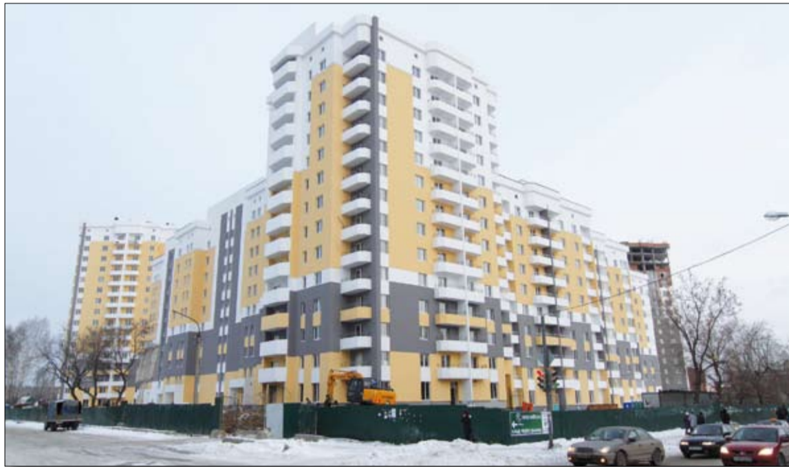
Скоро в Садовом начнут праздновать новоселья.

Но когда мы говорим о социальном развитии административного центра городского округа, нужно