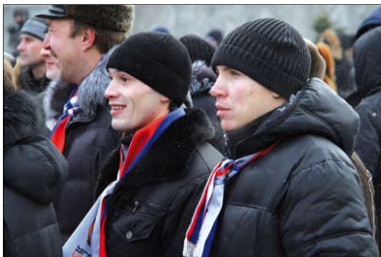
«Мы на митинге в первый раз. Так здорово!»