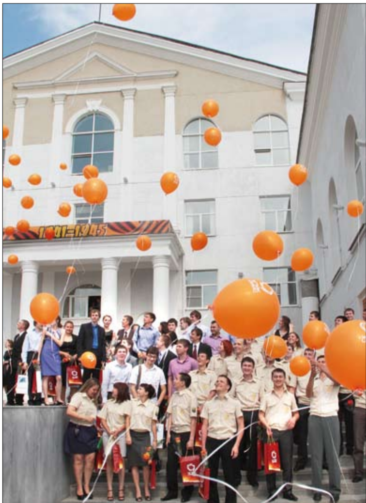
Шары-мечты взмывают ввысь.