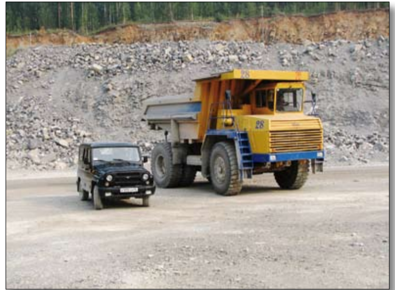
Мощный джип по сравнению с БелАЗом – просто игрушка.

Их «поджидали» несколько элементов фигурного вождения: змейка впереди задним ходом, разворот в круге, парковка в «гараж», колея и стоп-линия. Минимальные расстояния между колышками в сочетании с внушительными габаритами автомобиля обусловили высокий уровень сложности