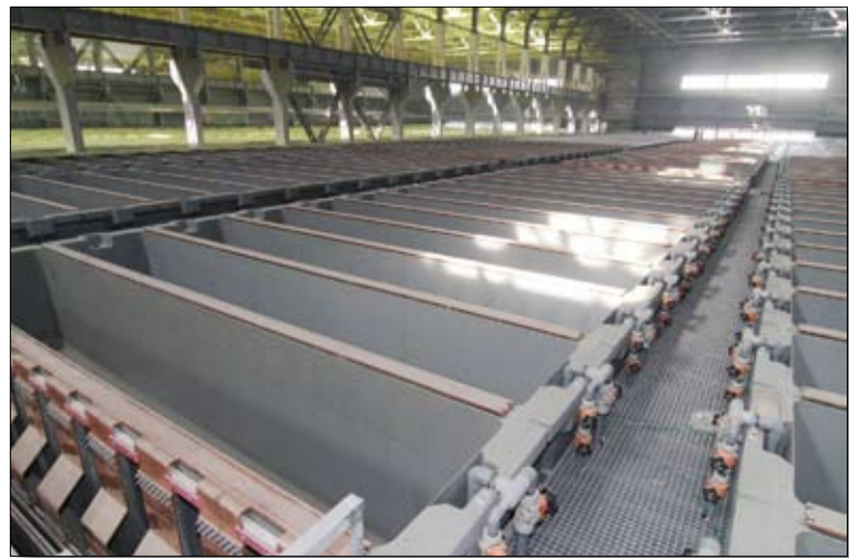
Новые ванны ждут пуска.