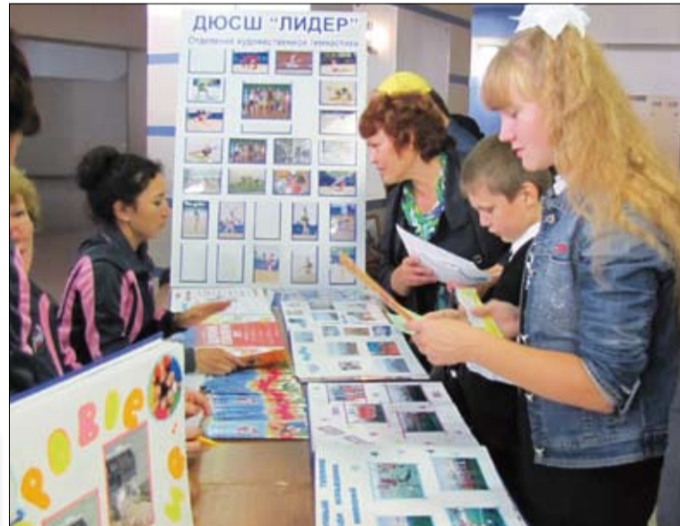
Какую же секцию выбрать? Хочется во все!