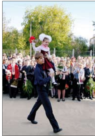
На линейке — шефы и подшефные.

Насколько я помню, едва ли не каждое мое школьное Первое сентября начиналось с созерцания унылого пейзажа за окном: пасмурное небо, а то и вовсе накрапывающий дождик. В этом году небесные силы порадовали нас солнечной и теплой погодкой. Повезло детишкам! Не надо им надевать куртки и резиновые сапоги, прятать под верхней одеждой так тщательно подобранные, отутюженные наряды. Налегке, в красивых белоснежных рубашках, вместе с родителями идут они по улицам Верхней Пышмы в свои