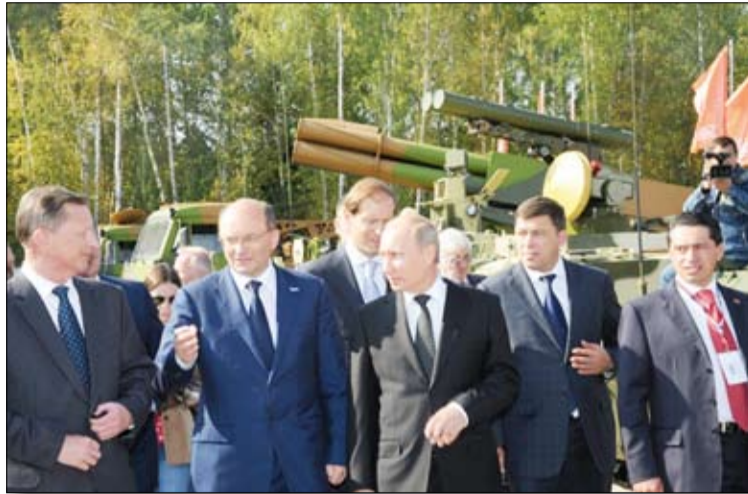
На прошлой неделе Российской выставке вооружения в Нижнем Тагиле. Владимир Путин знакомится с продукцией уральских оборонных заводов.

Наш музей ведёт эту работу постоянно и последовательно. Здесь каждый экспонат — это живая история. И ребята, которые бывают у нас постоянно, узнают в музее, подчас, больше, чем на уроках истории в школе. Безмолвные свидетели великих сражений помогают оживить эпизоды битв, в которых участвовала наша армия. И слова «Родина», «Победа», «Патриотизм» перестают быть для ребят отвлечёнными понятиями.