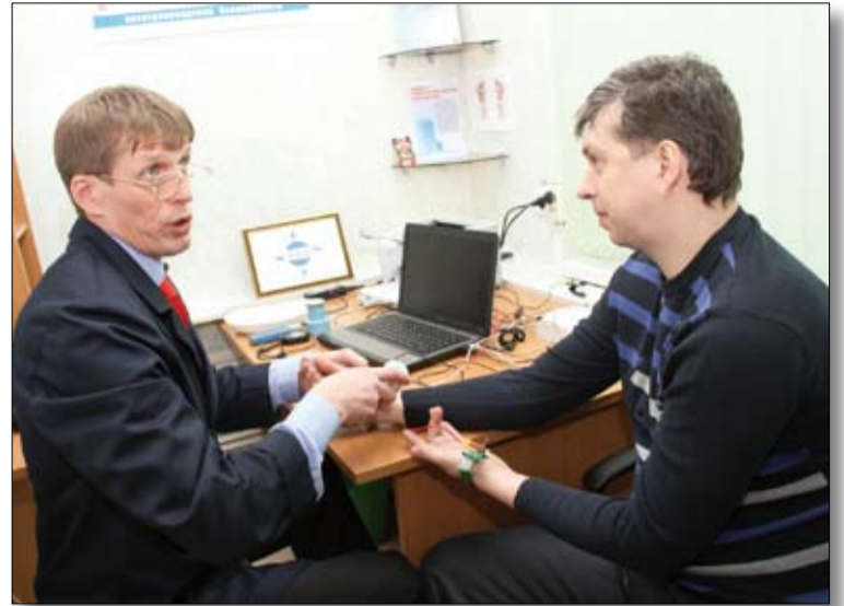
За 10 минут обследования можно понять, как будет работать организм водителя в этот день.

восьми часов непрерывной работы водитель увидит дорожный знак не за 100 метров, а за 80.