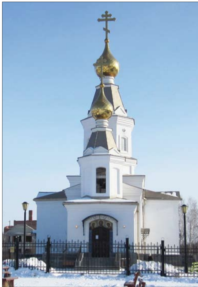
Приход во имя Александра Невского в селе Балтым.