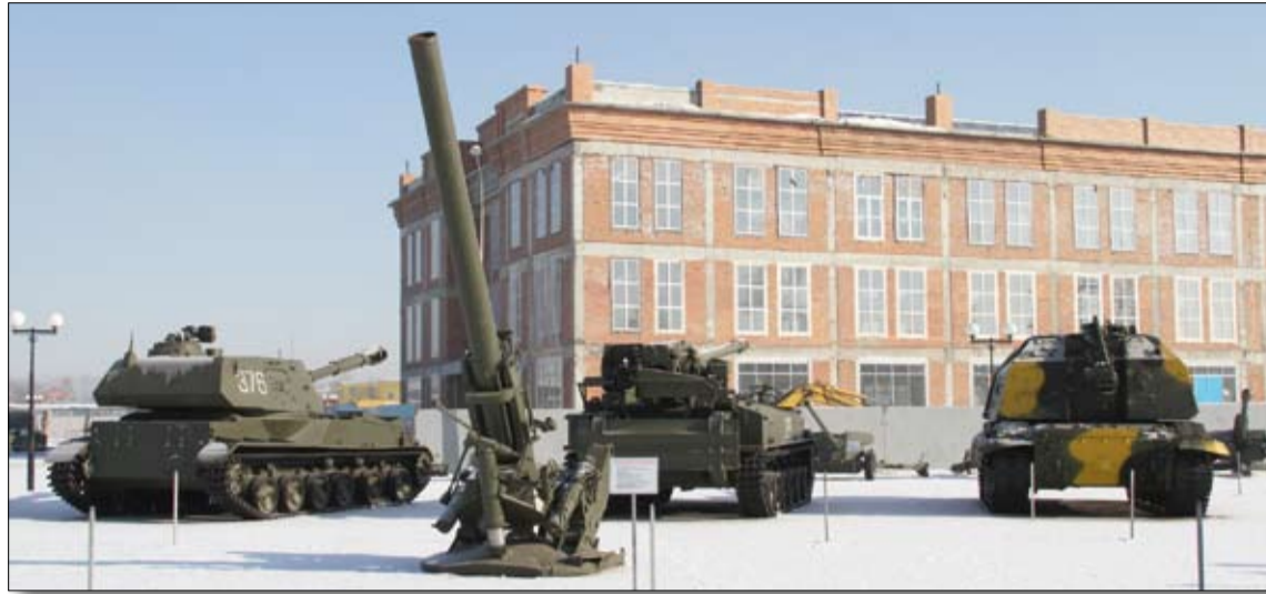
Экспозиционно-выставочный комплекс станет ещё одной достопримечательностью Среднего Урала.

статус общественного филиала Центрального музея вооружённых сил в Москве, и на базе нашего, верхнепышминского, музея будет создан центр историко-патриотического воспитания и работы с допризывной молодёжью.