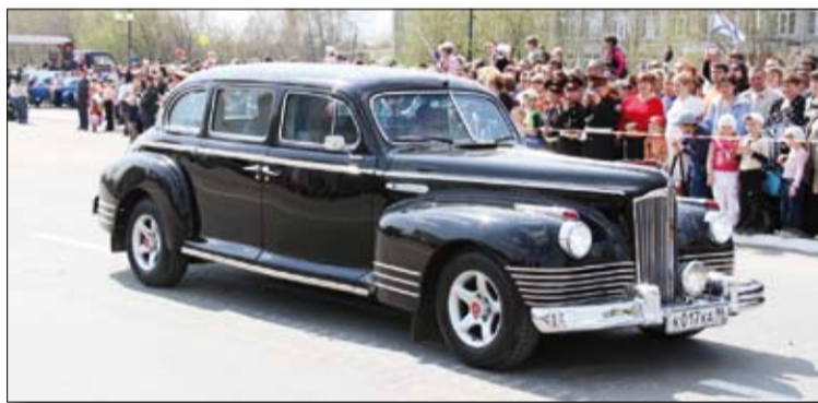
Красавцы-ветераны всегда в идеальном порядке.

ЕЖЕГОДНО музей военной техники «Боевая слава Урала» в Верхней Пышме встречает сотни посетителей, половину из которых составляют дети. Но как рассказать об истории Родины так, чтобы маленький гражданин мог гордиться тем, что живёт в этой стране? Как сделать это интересно?