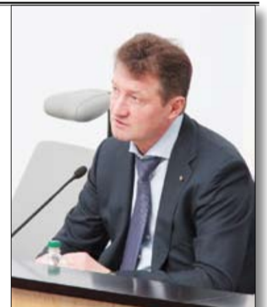
...и точные ответы.