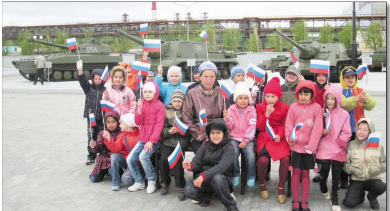
Будущие защитники Отечества – желанные гости в музее «Боевая слава Урала».